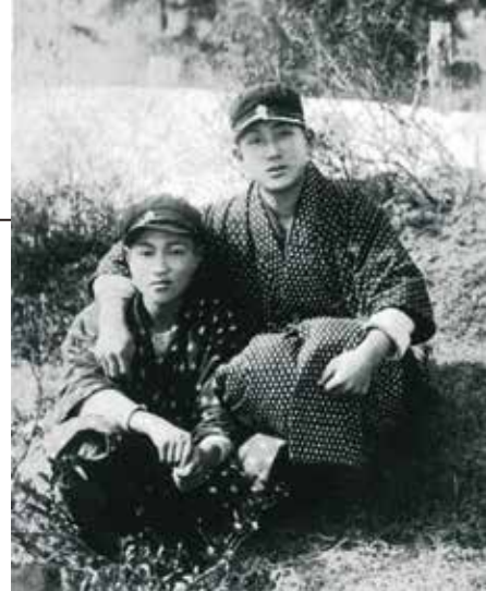
▲ 少年時代の操さん（左）と友人。昭和5年頃。