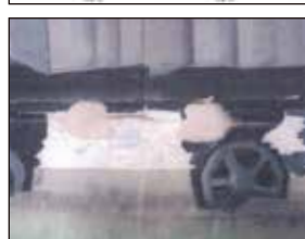
▲修復時の資料（写真上《隅田河岸》、写真下《貨車》）。作品は絵の具が割れていたほか、穴が空いていたものも。