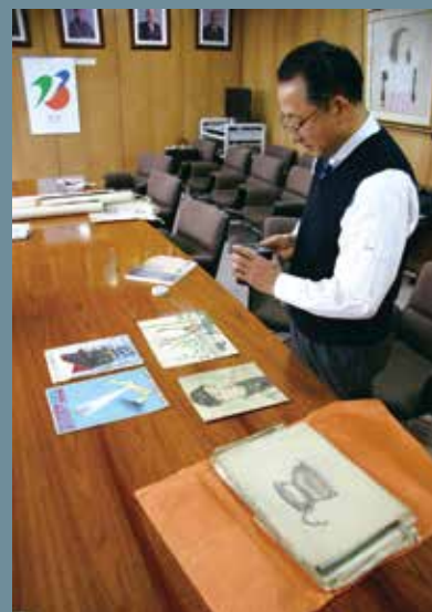
▲ 鑑定時の様子。平成 21 年撮影。

これまで、操の初期の作品はすでに存在しないものと思われていました。ですので、こんなにまとまって、しかも画学校時代のものが出てきたというのは