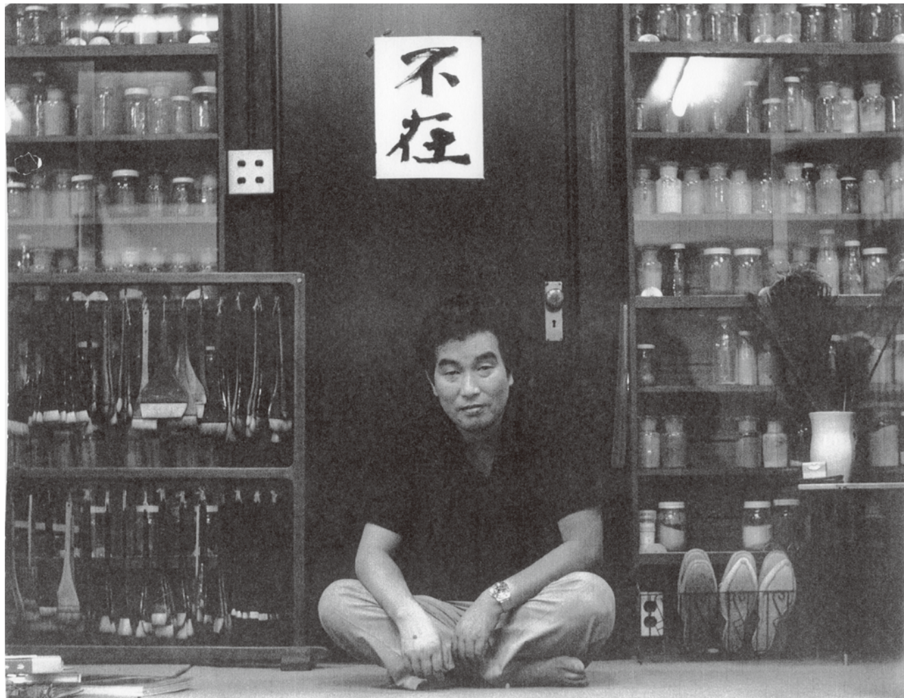
▲ アトリエでの1枚。整然と並ぶ画材に 几帳面な性格が伺えます。

●参考文献 木村拓也 (2019)「燃える魂の画家・横山操」『青龍社創立九十周年特別展 龍子と同時代の画家たち』大田区文化振興協会 93-95 頁 / 横山秀樹 (2008)「日本画壇の風雲児 横山操の生涯」『花美術館』vol.5 株式会社花美術館 4-35 頁 / 横山秀樹 (2020)「横山操の知られざる顔」『生誕 100 年記念 日本画家・横山操—その画業と知られざる顔』富山県水墨美術館、新潟市新津美術館、アートインプレッション 6-19 頁 ●写真は取材過程で関係者より提供。掲載関係者でご連絡のつかなかった方がおります。関係者の方は、お手数ですが地域振興課広報広聴係までご連絡ください。