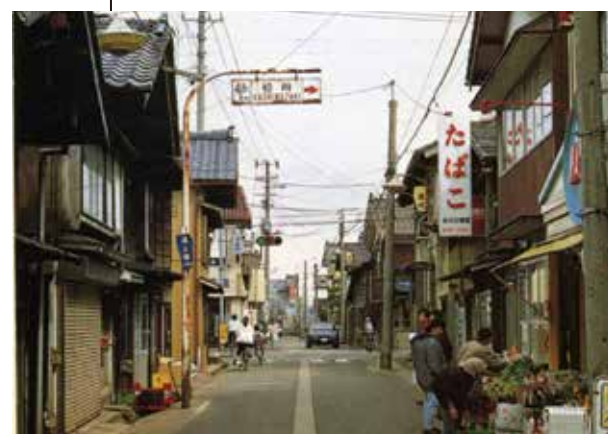
▲ 操さんが過ごした吉田の商店街（撮影年不明）。

操さんは新潟からタクシーで吉田まで出向き、スケッチをしていました。晩年に至るまで、新潟県や吉田町の風景を描いた作品を多く残しています。吉田の街があり、少し行くとすぐに草原があり、そこにハザ木