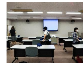
パナソニック㈱ライフソリューションズ社を見学