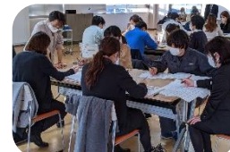
『20代から考えるこれからの人生～マイキャリア×ライフプランセミナー～』の様子