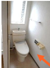
2階にもトイレが！ 忙しい時間のトイレ争 奪戦が緩和されます ね！