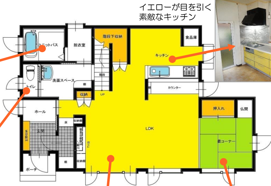
イエローが目を引く 素敵なキッチン