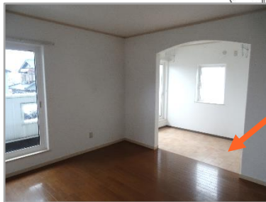
洗濯物をたくさん干せそうなバルコニーに加え、 サンプルームも！！ 雨が多い地域にはありがたいです。