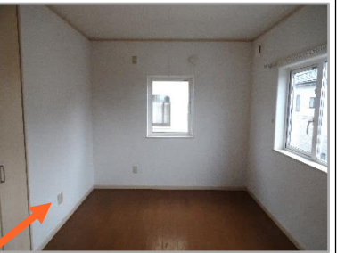
白い壁は、今のご時世、 リモートワークをするの に最適！ 画面の背景に困らずに済 みます。