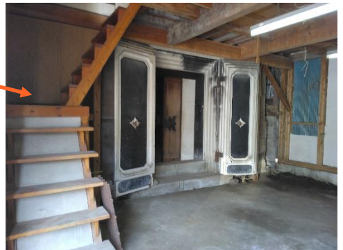
蔵に続く扉は、重厚感があり歴史を非常に感じる意匠性の高いデザインです！