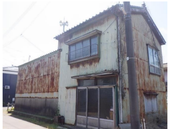
外側のトタンを外すと、土蔵の外壁が現れます！